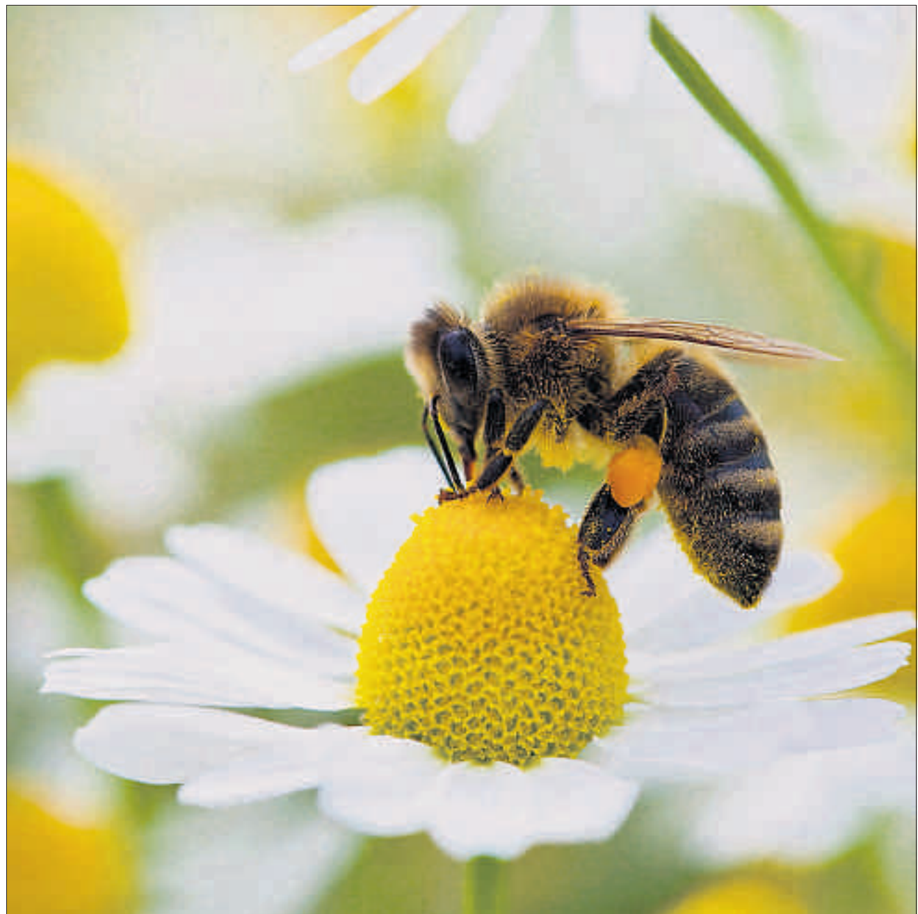
Glückliche Landung: Eine Biene sammelt Pollen.

Den Hinterleib rhythmisch hin- und herbewegend, läuft die Tänzerin ein kurzes Stück geradeaus (1) kehrt danach in einem Bogen zum Ausgangspunkt zurück und startet zu einer neuen Schwänzelstrecke (2), an deren Ende sie in die entgegengesetzte Richtung abdreht. Der Winkel der Schwänzelstrecke zur Richtung der Schwerkraft entspricht der Richtung zur Futterquelle relativ zur Sonne. Und die Dauer der Schwänzelphase bestimmt deren Entfernung.